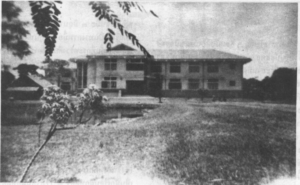
ตึก ๑ หอนอนและที่เรียนของนักเรียนฝึกหัดครูรุ่นแรก ด้านข้างจะมองเห็นโรงอาหารชั่วคราว

ต่อปี ต่อมาได้เพิ่มเป็นทุนละ ๒,๕๐๐ บาท ต่อปี ทุนนี้ มีข้อผูกพันที่จะต้องรับราชการให้กับทางราชการเป็น สองเท่าของเวลาที่เรียน