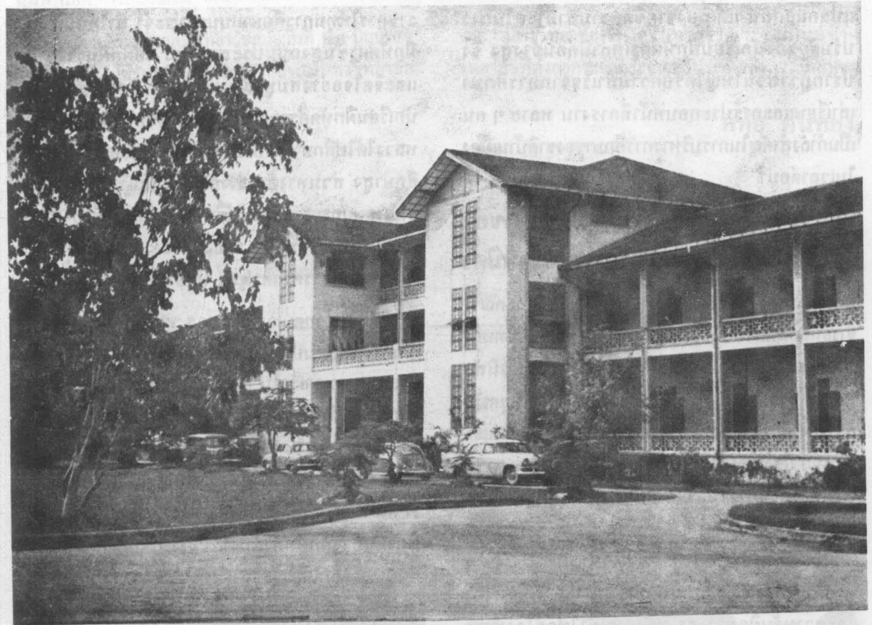
ตึก ๓ ตึกเรียนซึ่งเหลือเป็นอนุสรณ์อยู่ในปัจจุบัน