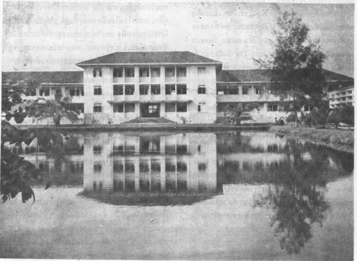
ตึก ๒ หอนอน