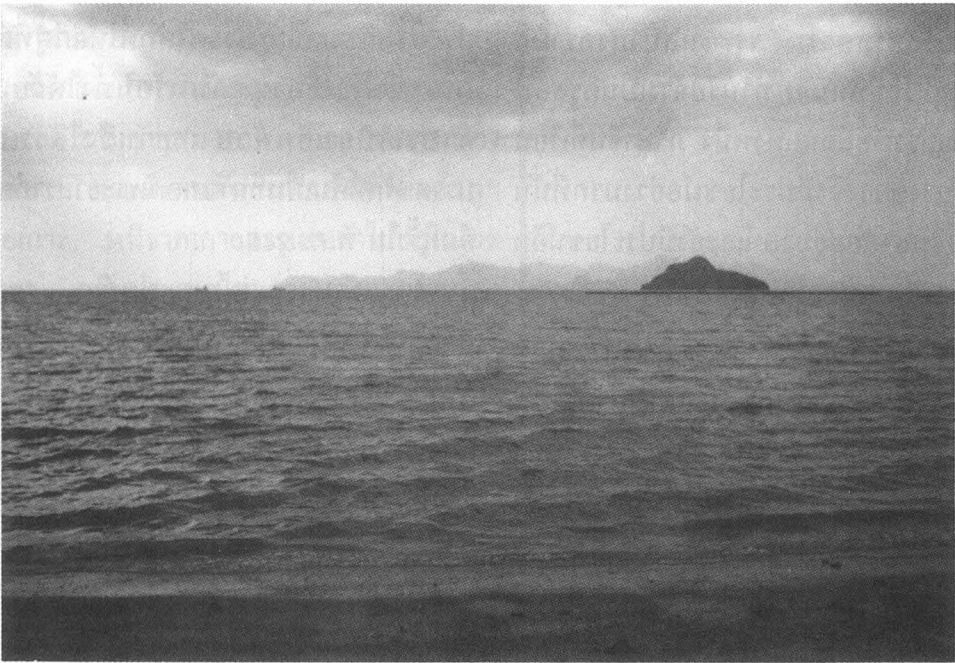
เกาะตะรุเตา (เห็นเป็นเงาดำๆ หลังเกาะเล็ก ๆ) ถ่ายจากหาดทรายดำ บนเกาะลังกาวิ