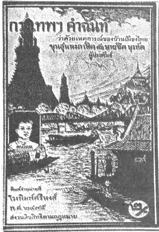
ปกหนังสือรวมงานของขัต บวรทัต ที่มีการพิมพ์จำหน่าย(เท่าที่ค้นพบ)