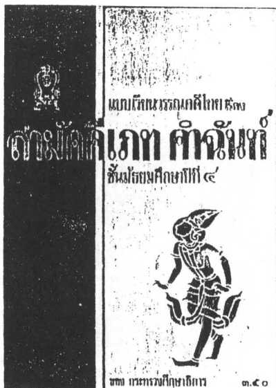
ภาพปกหนังสือ “สามัคคีเภทคำฉันท์” ผลงานชิ้นเอกของ ชิต บูรทัด ที่มีกรพิมพ์ซ้ำ