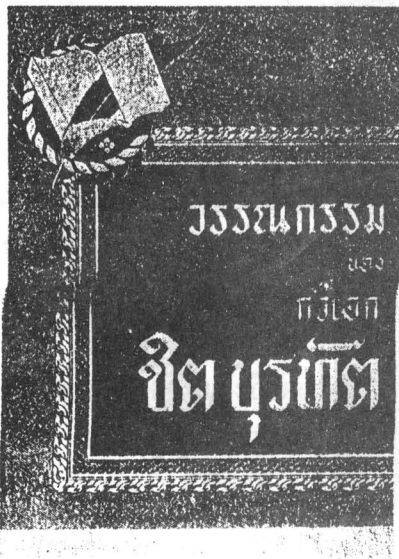
ฉบับพิมพ์โดยบริษัทโอเคียเนสโตร์(๒๔๙๔)