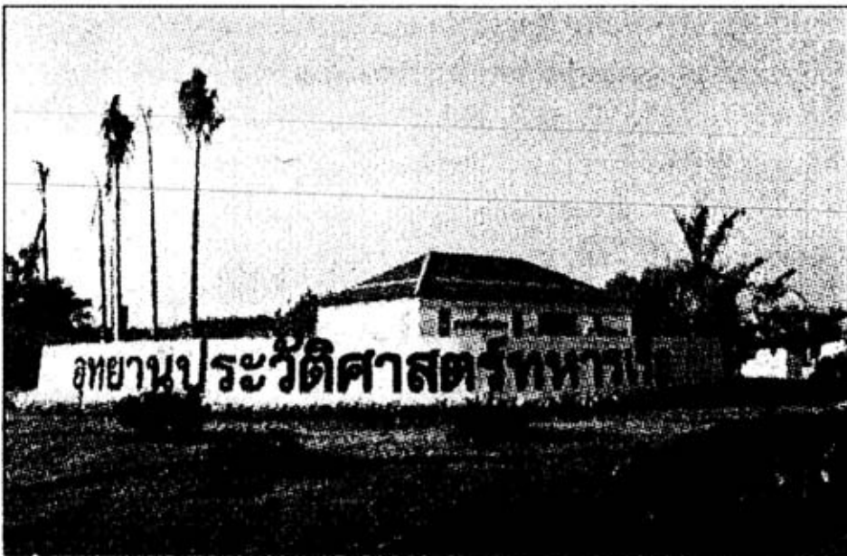
อุทยานประวัติศาสตร์ทหารเรือ

ป้อมพระจุลจอมเกล้าสร้างขึ้นใน พ.ศ. 2436 โดยพระบาทสมเด็จพระจุลจอมเกล้าเจ้าอยู่หัว โปรดเกล้าฯ ให้สร้างขึ้นเพื่อเตรียมการรองรับการรุกรานของอริราชศัตรูที่อาจจะเกิดขึ้นได้ในช่วงเวลานั้น ทั้งนี้เพราะในสมัยนั้นประเทศไทยเสียเปรียบบรรดาประเทศต่างๆ ที่ล่าอาณานิคมอยู่รอบๆ ประเทศและประเทศเหล่านั้นจะเรียกธงสิทธิต่างๆ อยู่เสมอ พระองค์รับสั่งให้คณะกรรมการชุดหนึ่งสำรวจพื้นที่และดำเนินการก่อสร้างขึ้นบริเวณตำบลแหลมฟ้าผ่า โดยพระองค์ทรงสละทรัพย์สินส่วนพระองค์เป็นจำนวนหนึ่งหมื่นชั่ง (800,000 บาท) เป็นค่าก่อสร้าง ใช้เวลาก่อสร้างกว่า 1 ปี เมื่อการก่อสร้างใกล้สำเร็จพระองค์ได้เสด็จพระราชดำเนินโดยเรือพระที่นั่งจักรีไปทอดพระเนตรและทรงตรวจงาน เมื่อวันที่ 10 เมษายน พ.ศ. 2436