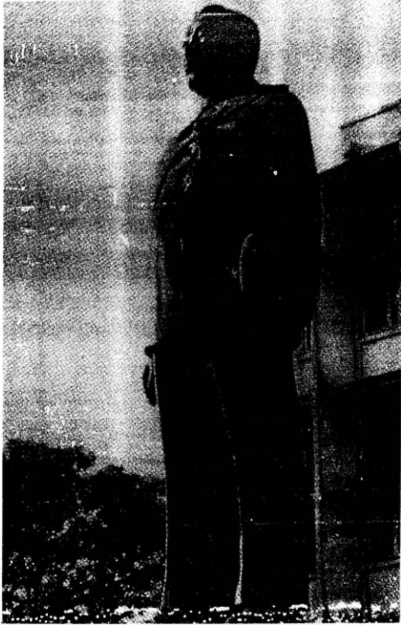
อนุสาวรีย์หลวงสุวรรณวาจกกสิกิจ หน้าหอประชุม มหาวิทยาลัยเกษตรศาสตร์ บางเขน