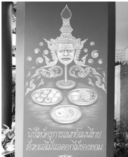
ภาพประกอบที่ 7

จิตรกรรมลวดลายเกี่ยวกับหัตถการรักษาดโดยหมอไทย ดังภาพประกอบที่ 9 และ 10