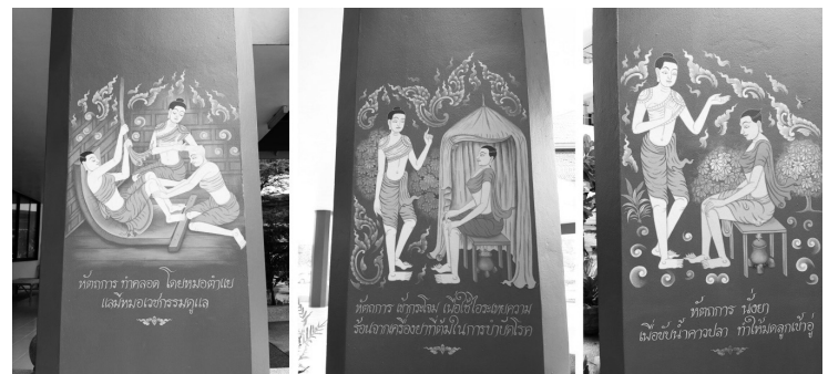
ภาพประกอบที่ 11

จิตรกรรมลวดลายแสดงถึงการบริหารแบบฤษีตัดตน ดังภาพประกอบที่ 8