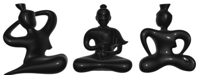
ภาพประกอบที่ 3

ประติมากรรมกึ่งเสมือนจริงรูปทรงหม้อยาเส้นผ่านศูนย์กลาง 3.5 เมตร สูง 4 เมตร ด้วยแนวคิดจากโครงสร้างเส้นโค้งของรูปทรงหม้อยาไทยโดยมีความหมายในแต่ละองค์ประกอบดังภาพประกอบที่ 2 เส้า 4 เส้า คือ การแพทย์แผนไทย 4 ด้าน ได้แก่ เวชกรรมไทย เภสัชกรรมไทย ผดุงครรภ์ไทย หัตถการนวดไทย โดยในแต่ละเส้ามีเส้น 10 เส้น แทนรศยา 10 รศของสมุนไพรรไทย เส้นวงกลม 5 วง แสดงยุทธศาสตร์และเป้าประสงค์ของกรมการแพทย์แผนไทยและการแพทย์ทางเลือก 5 ด้าน