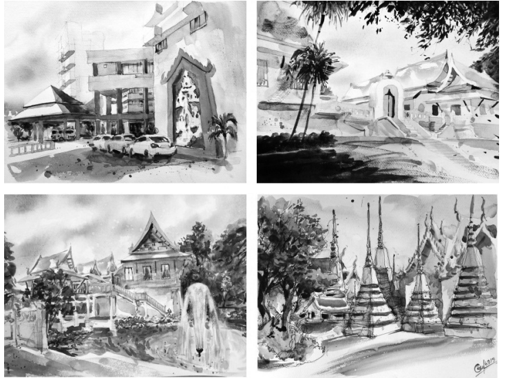
ภาพประกอบที่ 5

จิตรกรรมสีน้ำในรูปแบบความประทับใจฉับพลัน (Impressionism) มีขนาดภาพประมาณ 29 x 42 เซนติเมตร จำนวน 4 ชิ้น ดังภาพประกอบที่ 5 ได้แก่ ภาพจิตรกรรมสีน้ำที่ 1 อาคารกรมการแพทย์แผนไทยและการแพทย์ทางเลือก ภาพจิตรกรรมสีน้ำที่ 2 เรือนหมอเพ็ญนภา ภาพจิตรกรรมสีน้ำที่ 3 อาคารทรงไทยพระยาพิศณุประสาทเวช (เรือนหมอลง) และภาพจิตรกรรมสีน้ำที่ 4 วัดพระเชตุพนวิมลมังคลารามราชวรมหาวิหาร