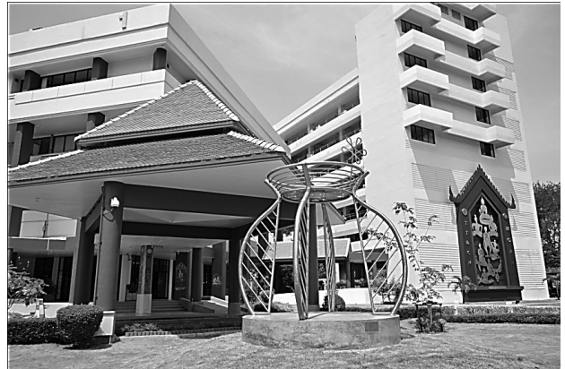
ภาพประกอบที่ 2

ประติมากรรมกึ่งเสมือนจริงรูปทรงหม้อยาเส้นผ่านศูนย์กลาง 3.5 เมตร สูง 4 เมตร ด้วยแนวคิดจากโครงสร้างเส้นโค้งของรูปทรงหม้อยาไทยโดยมีความหมายในแต่ละองค์ประกอบดังภาพประกอบที่ 2 เส้า 4 เส้า คือ การแพทย์แผนไทย 4 ด้าน ได้แก่ เวชกรรมไทย เภสัชกรรมไทย ผดุงครรภ์ไทย หัตถการนวดไทย โดยในแต่ละเส้ามีเส้น 10 เส้น แทนรศยา 10 รศของสมุนไพรรไทย เส้นวงกลม 5 วง แสดงยุทธศาสตร์และเป้าประสงค์ของกรมการแพทย์แผนไทยและการแพทย์ทางเลือก 5 ด้าน