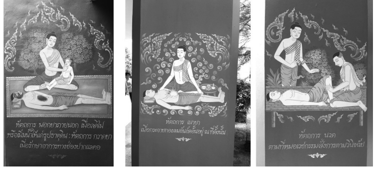
ภาพประกอบที่ 9

จิตรกรรมเสาแสดงอัตลักษณ์ธาตุทั้งสี่ตามหลักของการแพทย์แผนไทย ดังภาพประกอบที่ 6 อ้างอิงถึงจิตรกรรมเสารายรอบหน้าอาคารกรมพัฒนาการแพทย์แผนไทยและการแพทย์ทางเลือกที่แสดงอัตลักษณ์ธาตุสมุฏฐานใช้ลวดลายเทพพนม ด้วยความเชื่อว่าเทวดาหรือเทพเป็นสิ่งศักดิ์สิทธิ์ช่วยปกป้องรักษาอาคารสถานที่ และรายล้อมด้วยสัญลักษณ์ที่สื่อถึงธาตุดิน น้ำ ลม ไฟ ตามหลักวิชาการแพทย์แผนไทย