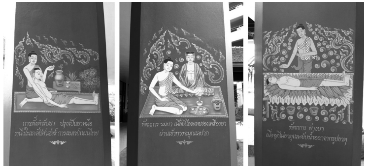
ภาพประกอบที่ 10

จิตรกรรมลวดลายแสดงถึงองค์ประกอบของพิธีไหว้ครุแพทย์แผนไทย ดังภาพประกอบที่ 7