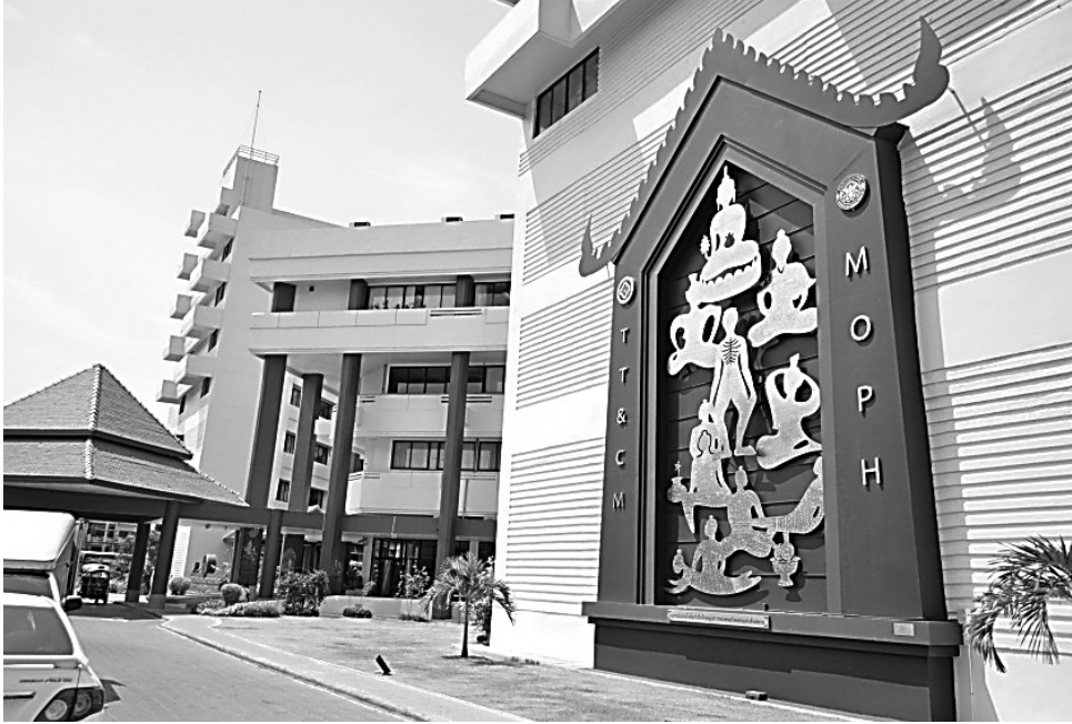
ภาพประกอบที่ 12

ศิลปะประดับผนังอาคาร (Wall Art) กว้าง 8 เมตร สูง 12 เมตร ลึก 1 เมตร ใช้แนวความคิดการออกแบบสร้างสรรค์ที่เน้นรูปด้านหน้า เพื่อตอกย้ำและสร้างการจดจำ ติดตั้งหน้าอาคาร 3 กรมการแพทย์แผนไทยและการแพทย์ทางเลือก ดังภาพประกอบที่ 12 โดยสร้างจากสแตนเลส (Stainless Steel) โดยใช้แผ่นการผลิตแบบ Laser Cut ซึ่งตอบสนองภาพลักษณ์ที่ผ่านการลดทอนรูปร่างให้มีความเรียบง่าย และง่ายต่อการจดจำ ตลอดจนควบคุมความสอดคล้องกันในแบบองค์รวมได้เป็นอย่างดี