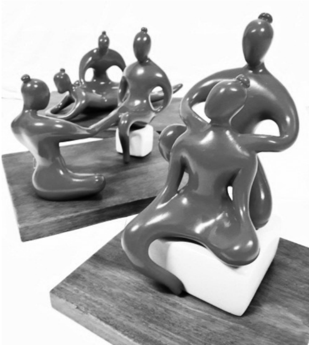
ภาพประกอบที่ 4

ประติมากรรมบรมครูทางการแพทย์แผนไทย ทั้งสามชิ้นงานในรูปแบบ 3 มิติ ดังภาพประกอบที่ 3 เป็นผลงานศิลปกรรมสร้างสรรค์ชุดประติมากรรมบรมครูการแพทย์แผนไทย ประกอบด้วยบรมครูหมอชีวกโกมารภัจจ์ และบรมครูฤษีท่งท่งทำดัดตน 2 ท่งท่งทำในรูปแบบลดทอนเป็นกึ่งนามธรรม (Semi Abstract)