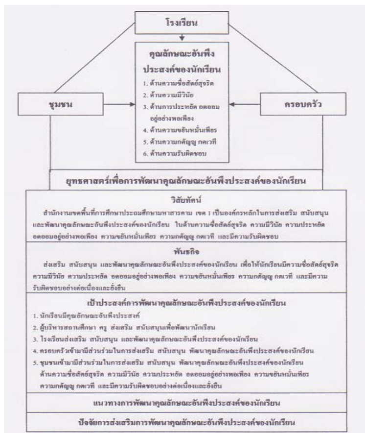
ภาพที่ 2 ยุทธศาสตร์เพื่อพัฒนาคุณลักษณะอันพึงประสงค์ของนักเรียน สำนักงานเขตพื้นที่การศึกษาประถมศึกษามหาสารคาม เขต 1

ยุทธศาสตร์เพื่อการพัฒนาคุณลักษณะอันพึงประสงค์ของนักเรียน สำนักงานเขตพื้นที่การศึกษาประถมศึกษามหาสารคาม เขต 1 เป็นยุทธศาสตร์ที่มีความเหมาะสมในการพัฒนานักเรียนนอกจากนี้ผู้เข้าร่วมจัดทำประชาพิจารณ์ ยังให้ความคิดเห็นว่าเป็นแนวทางที่เหมาะสมและมีประโยชน์ต่อการนำไปใช้อย่างยิ่ง มีความเชื่อมโยงสัมพันธ์กัน มีข้อสรุปจากผลการวิจัยที่ผู้ปฏิบัติสามารถนำไปใช้ได้จริง