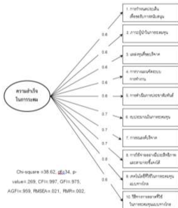
ภาพประกอบที่ 2 โมเดลองค์ประกอบเชิงยืนยันความสำเร็จในการระดมทุนของสถานศึกษา สังกัดสำนักงานเขตพื้นที่การศึกษามัธยมศึกษา กรุงเทพมหานคร เขต 2

การวิเคราะห์องค์ประกอบเชิงยืนยันขององค์ประกอบความสำเร็จในการระดมทุนของสถานศึกษา สังกัด สำนักงานเขตพื้นที่การศึกษามัธยมศึกษา กรุงเทพมหานคร เขต 2 ในการศึกษาวิจัยนี้ ประกอบด้วย 10 องค์ประกอบ คือ 1) การกำหนดประเด็นเพื่อขอรับการสนับสนุน 2) ภาวะผู้นำในการระดมทุน 3) แหล่งทุนที่ขอ บริจาค 4) การวางแผนจัดระบบการทำงาน 5) การดำเนินการประชาสัมพันธ์ 6) งบประมาณในการระดมทุน 7) การรณรงค์บริจาค 8) การใช้จ่ายอย่างมีประสิทธิภาพและสามารถชี้แจงได้ 9) เทคโนโลยีที่ใช้ในการระดมทุน แบบทางไกล และ 10) วิธีการตลาดที่ใช้ในการระดมทุนแบบทางไกล โดยมีผลการวิเคราะห์องค์ประกอบเชิง ยืนยัน (CFA)