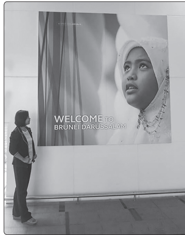
ภาพที่ 1 นักวิจัยเก็บข้อมูลวิจัยช่วงรอมฎอนกับการสะท้อนอัตลักษณ์ของมุสลิมในประเทศบรูไน (ที่มา: ภาพผู้วิจัย, 13 มิถุนายน 2559)