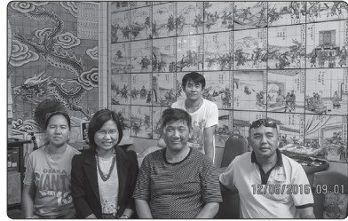
ภาพที่ 3 กรรมการสมาคมจีน และชุมชนชาวจีน กลางเมืองบันดาเสวีของบรูไน